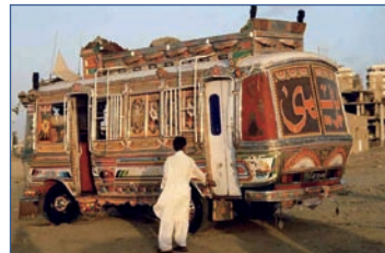
In Pakistan sind die Einheimischen mit den unterschiedlichsten Transportmitteln unterwegs.