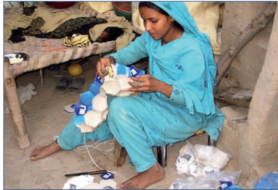
Ein Mädchen näht Fussbälle, die dann auch bei uns in der Schweiz verkauft werden.

In Pakistan sind viele Menschen arm. Sie führen ein sehr einfaches Leben. Nicht alle haben ein stabiles Haus. Elektrisches Licht ist Luxus. Ein eigenes Schlafzimmer kennen die wenigsten Kinder. Spielsachen, so wie wir Schweizer Kinder sie kennen, gibt es in Pakistan nur selten. Wir wünschen, dass diese Kinder trotzdem glücklich sind.