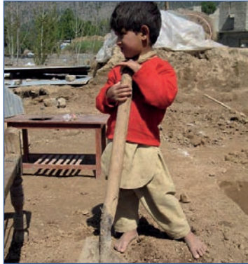
Hier bearbeitet ein kleiner Knabe den harten Boden. Ein Haus soll gebaut werden.

In Pakistan müssen viele Kinder während sieben Tagen in der Woche arbeiten und Geld verdienen. Diese Kinder dürfen nicht zur Schule gehen, sie lernen deshalb nicht lesen und auch nicht schreiben. Weil sie nicht lesen und schreiben können, ist es ihnen später auch nicht möglich, einen Beruf zu erlernen.