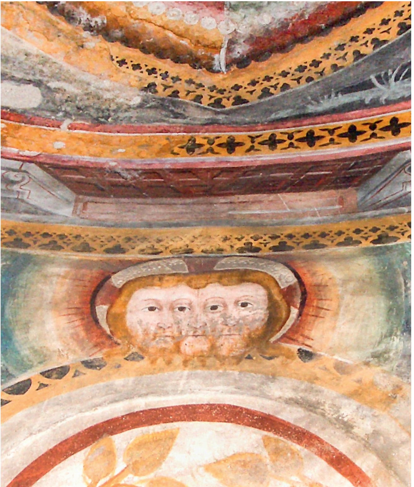
Die Dreifaltigkeit Gottes, mit einem dreistirnigen Antlitz dargestellt, das sich insgesamt vier Augen teilt (vultus trifrons). Mittelalterliches Fresko in der Kirche San Nicolao (Giornico, Tessin), 15. Jahrhundert.